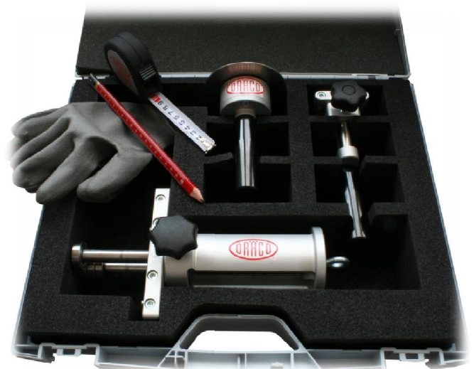
0°- 180° Kanten im Set 91545SET3

BKK25: Bördelkantung rund und gerade, konvex und konkav