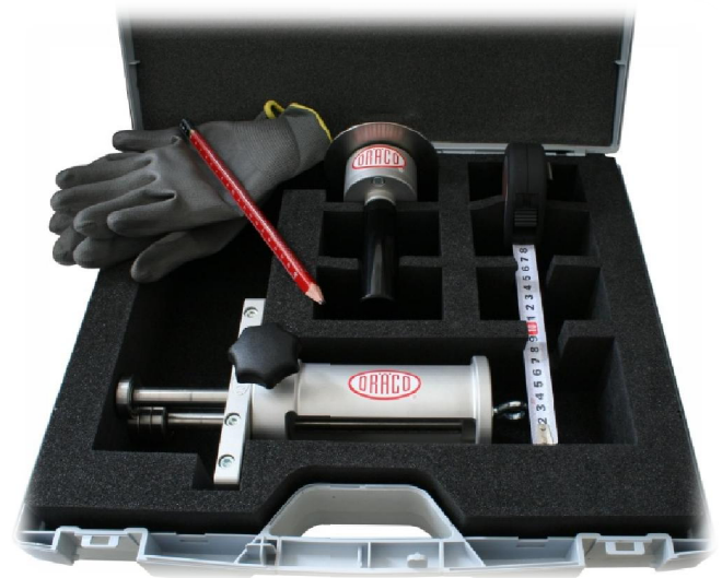
0°- 180° Kanten im Set 91545SET2